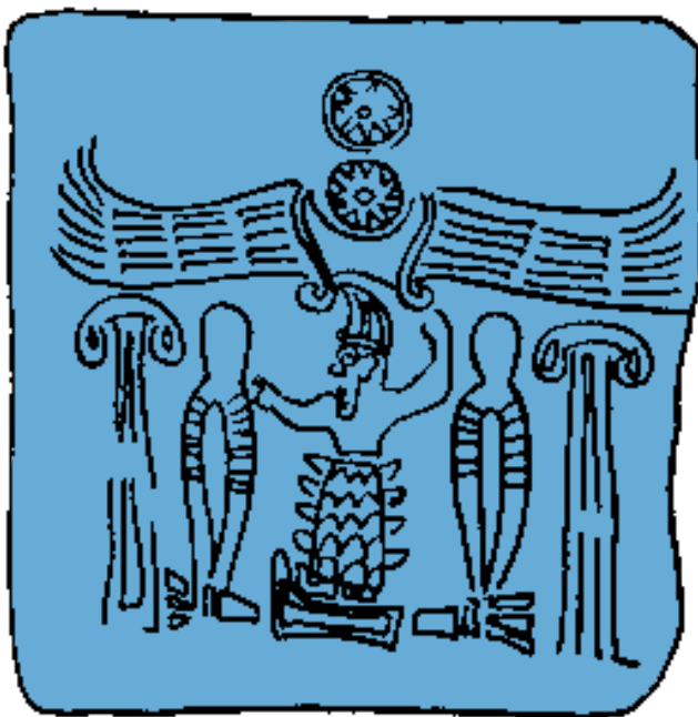
Hetitische inscriptie betreffende een inval van de zgn. "Zeevolken".

Verder bleek dat deze mensen d  ar woonden waar ook de Bijbel hen plaatst, namelijk in het gebied tussen Libanon en de Eufraat (Jozua 1:2-4). Toen een Duitse groep met opgravingen begon in Boghazk  y in Midden-Turkije, bleek dat men gestuit was op Hattusas, de hoofdstad van een uitgestrekt en uitermate welvarend Hetitisch rijk. De Hetieten waren van toen af aan niet langer een mysterie. Nadat hun thuisland en hoofdstad rond 1200 voor Christus werd verwoest, bleven er groepen Hetieten wonen op plaatsen in Syri   en Palestina, precies zoals uit de bijbelse