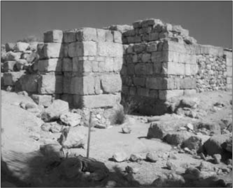
Megiddo in het noorden van Palestina aan de vlakte van Armageddon.

betrekking heeft op Armageddon. Het was de bedoeling om deze plaats geheel van boven tot onder af te graven en niets voor latere onderzoekers over te laten. Hoewel men gesteund werd door de schijnbaar onbeperkte fondsen van de Rockefeller's, moest men na verloop van tijd dit groots opgezette plan toch laten varen wegens geldgebrek. De expeditie was succesvol, maar het was een geluk dat een groot deel van Megiddo achter bleef voor latere archeologen. Sinds de jaren '30 heeft de archeologische wetenschap namelijk grote vorderingen gemaakt.