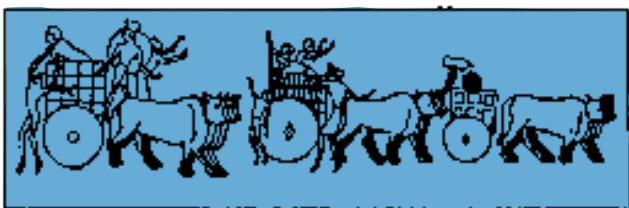
Hetitische tekening van krijgers.