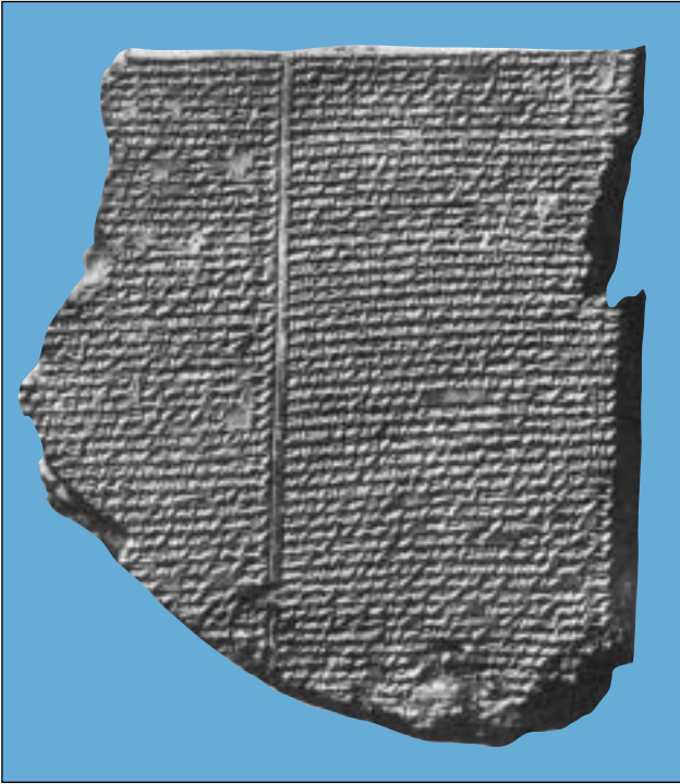
Een kleitablet met hiëroglfen met een deel van het zondvloedverhaal.

maar hij moet ook erkennen dat er vele andere factoren zijn die een dergelijke verwoesting veroorzaakt kunnen hebben. Werd de stad verwoest door een brand die plotseling uitbrak? Was de verwoesting te wijten aan de oorlogszuchtige Filistijnen, die ongeveer gelijktijdig met de Israëlieten Palestina binnenvielen? Of waren de Egyptenaren schuldig aan de vernietiging, toen zij vochten om hun steeds zwakker wordende Aziatische rijk in stand te houden? Of werd de stad vernietigd door de Hetieten, die vanuit het noorden Palestina binnenvielen? Zou een andere Kanaänitische stad bij een onverwachte aanval de vernietiging hebben veroorzaakt? Er is voldoende bewijs dat de Kanaänitische steden het niet altijd even goed met elkaar konden vinden.