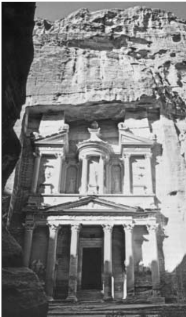
Ingang tot een van de gebouwen in Petra.

derheden te noteren van de ruïnes die zij op verschillende plaatsen zagen.