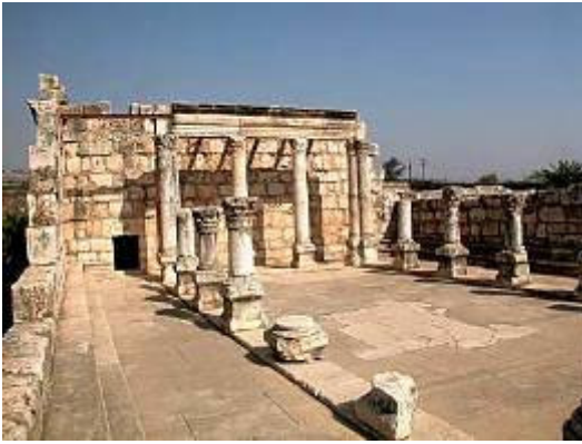
Synagoge te Kafarnaüm

De sequentie begint op sabbat in de synagoge (van Kafarnaüm - 1.21) en buiten de synagoge (1.29) en eindigt ook op sabbat buiten de synagoge (2.23) en in de synagoge (3.1).