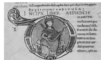
Salomo de wijze, 12 de eeuws handschrift

Kohelet doet zich voor als Davids zoon, koning te Jeruzalem.