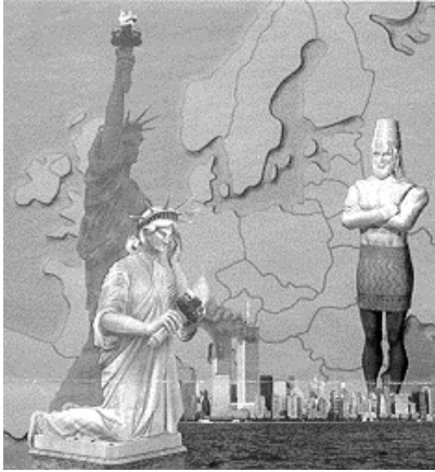
Etre libre et le rester...

Au § 3 il y a un jeu de contrastes entre "se prosterner", litt. "se plier, se courber" et "élever, être debout" (ces mots reviennent des dizaines de fois !). A la fin du récit les jeunes hommes sont jetés dans la fournaise, liés et enfin abaissés ou courbés... mais finalement on les retrouve marchant debout !