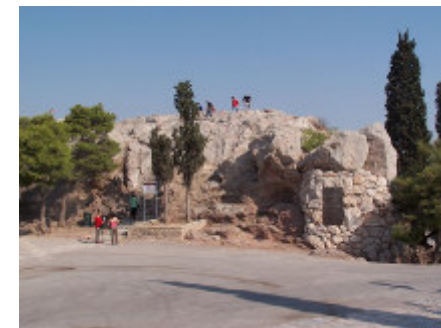
l'Aréopage à Athènes

Ce Dieu donne la pluie et les saisons fertiles, comblant les peuples de nourriture et de bonheur