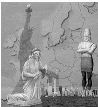
Etre libre et le rester...

Au § 3 il y a un jeu de contrastes entre "se prosterner", litt. "se plier, se courber" et "élever, être debout" (ces mots reviennent des dizaines de fois !). A la fin du récit les jeunes hommes sont jetés dans la fournaise, liés et enfin abaissés ou courbés... mais finalement on les retrouve marchant debout !