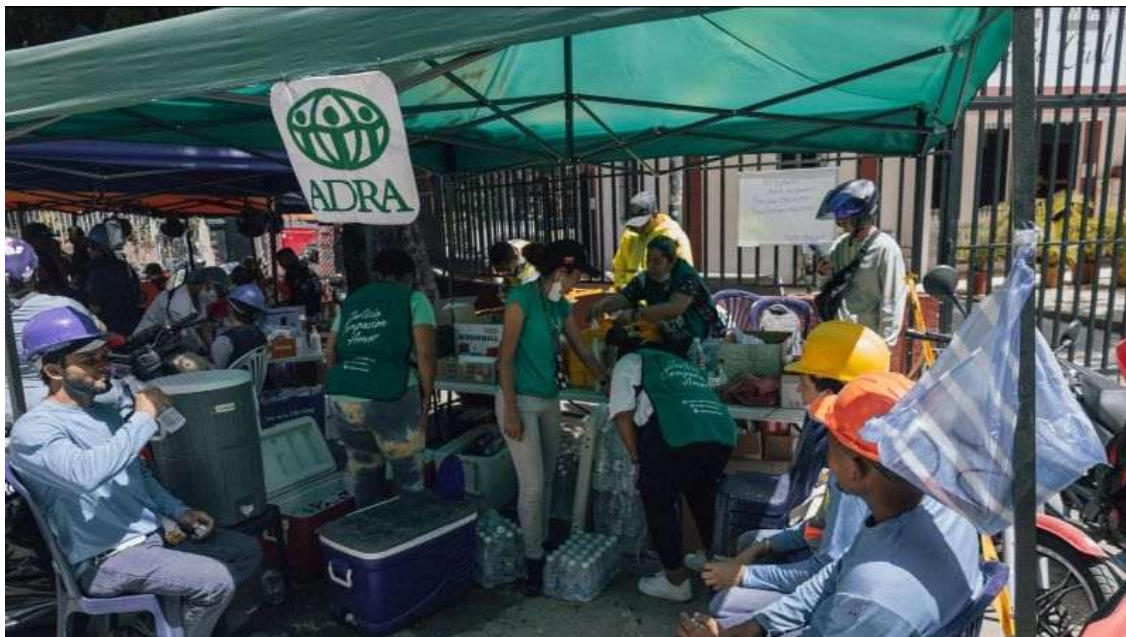
Des familles reçoivent une aide d'urgence au point d'assistance d'ADRA à La Guaira.

Dès le lendemain du séisme, les équipes d'ADRA étaient déjà mobilisées aux côtés des communautés touchées. Grâce à notre réseau de partenaires locaux, nous apportons une aide vitale aux familles qui ont tout perdu.